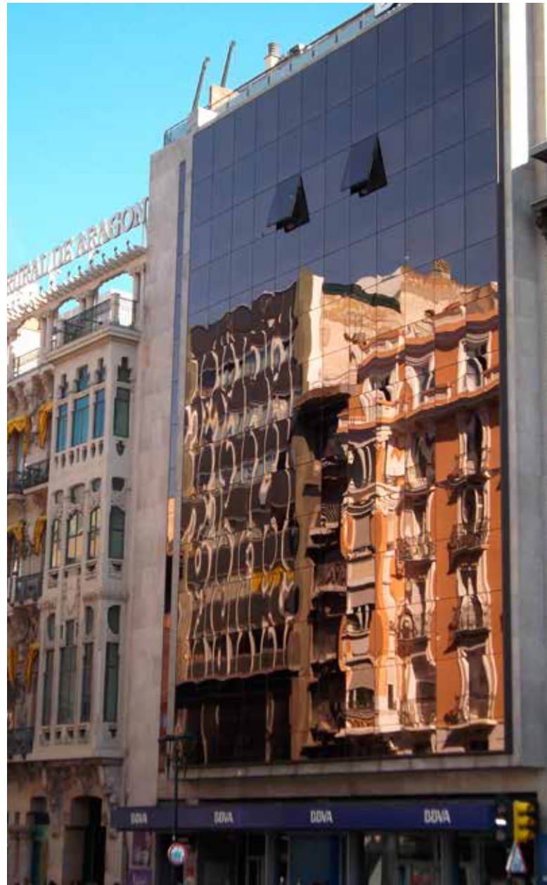
> Edificio en Zaragoza que alberga la sede del Colegio.

> El Colegio ha trabajado estrechamente con esas entidades durante muchos años. Un ejemplo es la Asociación de Entidades del Sistema de Seguridad Industrial de Aragón, creada e impulsada por el Gobierno de Aragón de la que formamos parte junto al Colegio de Ingenieros Técnicos, las Asociaciones de instaladores de electricidad, la de fontanería, de calefacción y la de ascensores, así como los cuatro organismos de control que más trabajan en Aragón. Hemos puesto en marcha una plataforma colaborativa para que todas las instalaciones de seguridad industrial puedan tramitar sus certificaciones telemáticamente y de manera totalmente distinta a como se hacía ahora. El Gobierno de Aragón ha tomado conciencia de sus deberes de inspección de las instalaciones que, por motivos humanos y económicos, antes no podía hacer. Con esta Asociación, las tramitaciones de todas las instalaciones se pueden gestionar a través de esta plataforma, porque todas estas instalaciones están localizadas y registradas en el catastro y, en cualquier momento, una persona que declare tener un interés legítimo en la instalación, sea un promotor o sea un usuario, puede saber si la instalación está registrada, si ha pasado las revisiones periódicas y, en suma, puede velar por la seguridad industrial de los ciudadanos.