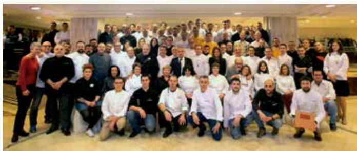
> Una parte de los cocineros que han aportado sus recetas estuvieron en la presentación del libro.

Pero no se trata solamente de ser una recopilación de recetas, sino que el libro recoge también 130 perfiles de chefs aragoneses o residentes en Aragón. En el transcurso de estas entrevistas, los profesionales han expresado las tendencias de sus